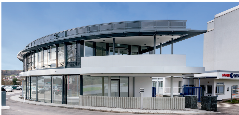
Unser Service-Zentrum in Bingen am Rhein

Alle Trainingsinhalte werden als Handout oder in elektronischer Form zum Nachschlagen bereitgestellt.