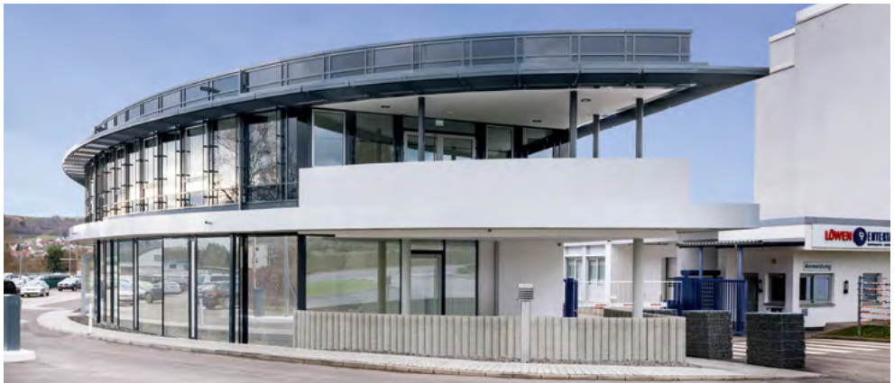
Unser Service-Zentrum in Bingen am Rhein

Die Trainings finden in Ihrem Unternehmen, unseren Vertriebs- und Serviceniederlassungen, ortsnahen Tagungsräumen, in unserem Service-Zentrum in Bingen oder neu mittels Live-Online-Training statt.